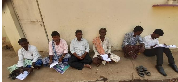
Resurvey of manual scavengers at Davangere city by NSKFDC officer. Manual scavengers meeting at Hosakundavada