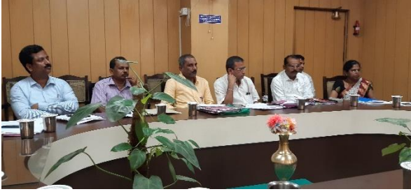
Discussion on rural manual survey.