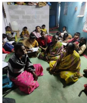
Parents and Community meeting on importance of Education at Davangere.