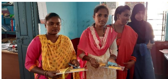
Tailoring supplementaru things distribute to youths.