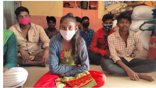
Youth meeting at area level at Davangere.