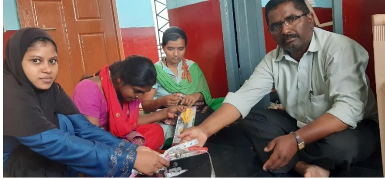
Tailoring supplementaru things distribute to youths.