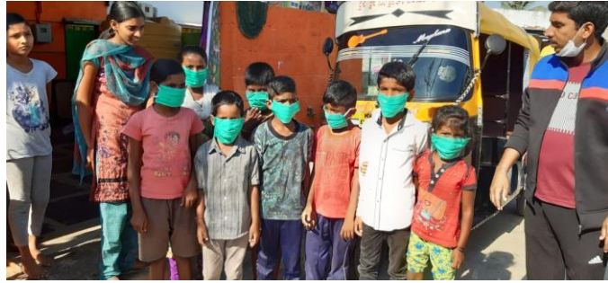
Mask Distribution to Children.