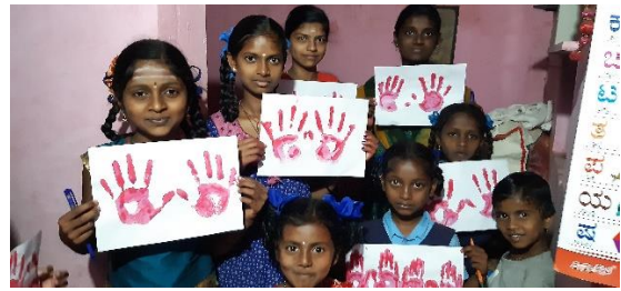
Red Hand Day celebration at Tuition centres level at Davangere.