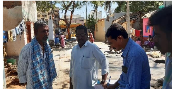
22-01-2020 Nituvalli, Davangere Prajavani reporter