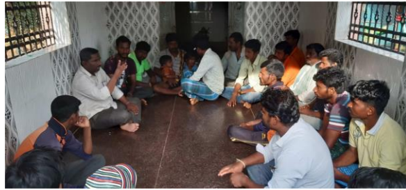
Rechecking and Community meetings