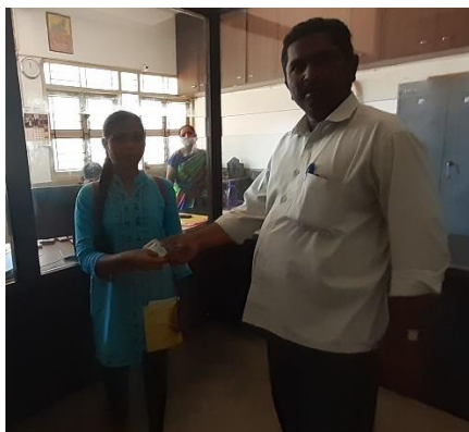
Educational Fee support for youths at Davangere.