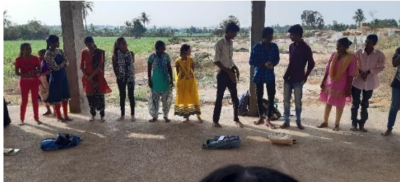
Date:18/01/2020 youth team visit to Sakhi NGO Hospete.